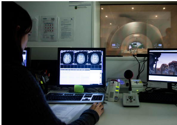
El FEDER ha cofinanciado la compra de la Unidad de Resonancia Magnética Funcional del BCBL

Para situar a Gipuzkoa en el primer nivel de desarrollo investigador e innovador, la Diputación Foral impulsa la Red de Ciencia, Tecnología e Innovación del territorio, un conglomerado de agentes públicos y privados que cuenta, además, con la contribución del FEDER a través del eje 1 del PO País Vasco 2007-2013